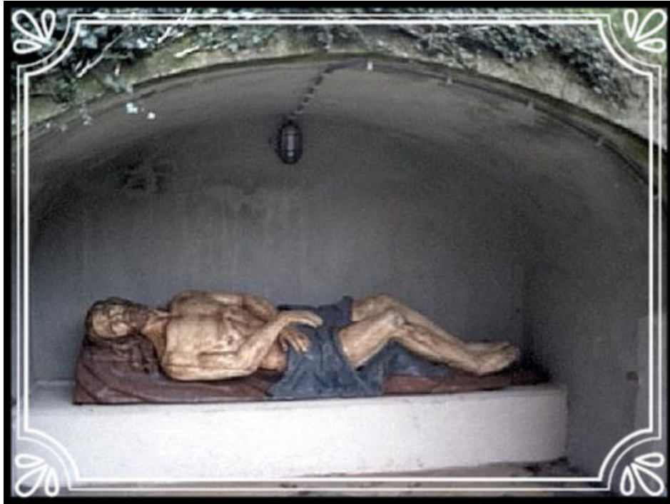
Het gerenoveerde Christusbeeld in het graf van Jezus