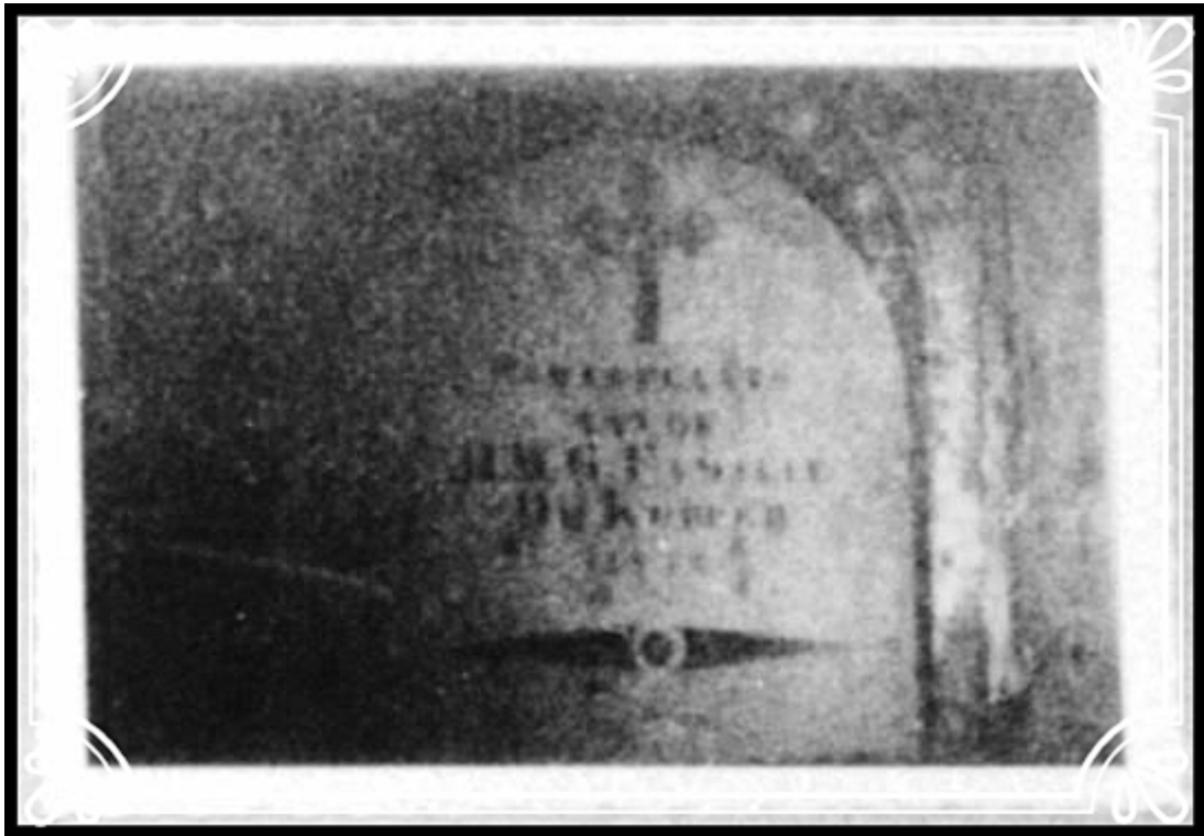
De originele sluitsteen is vernietigd

Twee beelden zijn naar beneden gestort (en staan nu naast het graf opgesteld, nl. de apostel Johannes en een Romeinse soldaat).