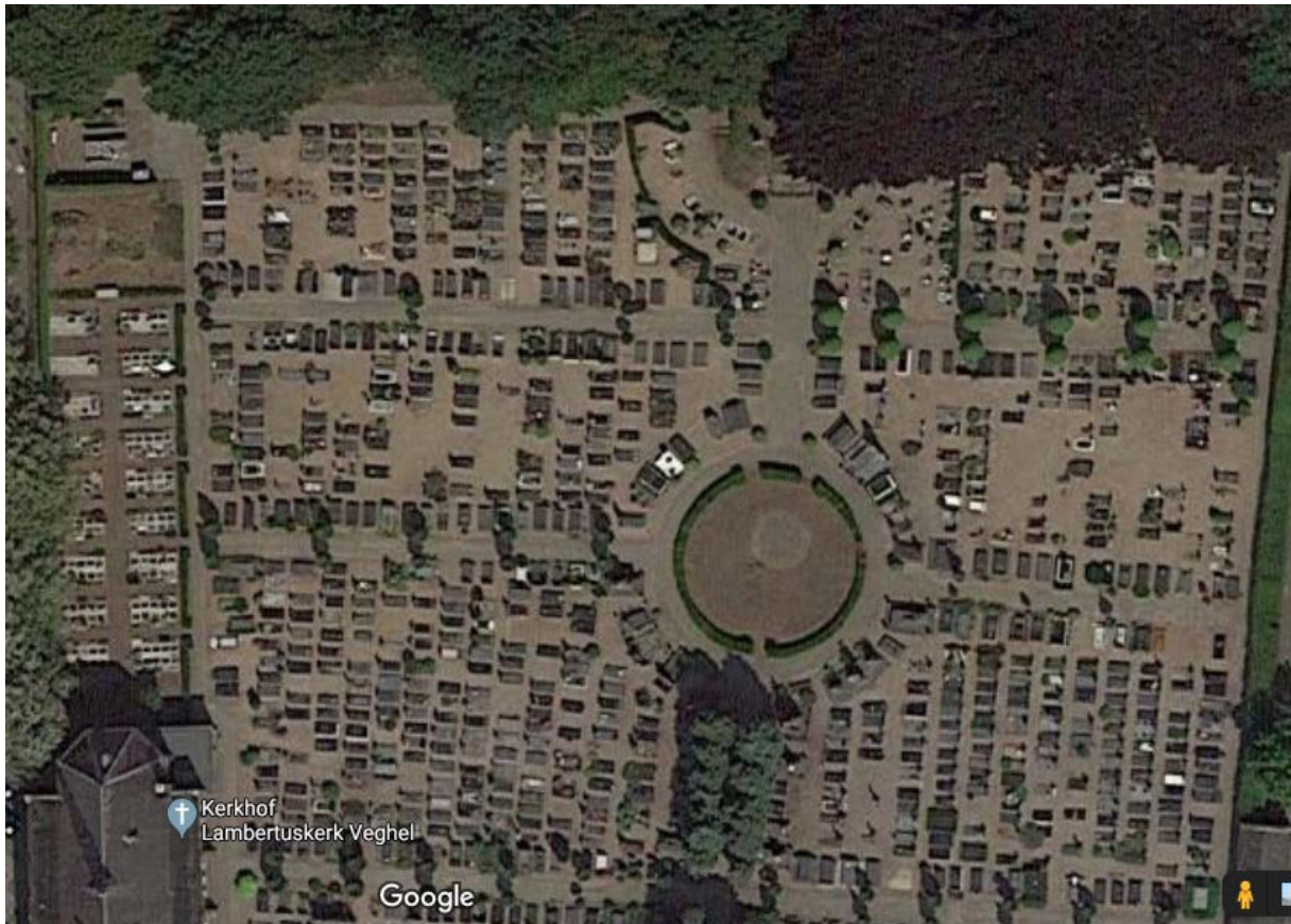
Google maps foto Kerkhof Veghel, met boven het pleintje tegen de bosrand de Calvarieberg of thans lauteringsberg 08/01/2020

Teksten hierboven zijn hoofdzakelijk uit de oude tijd overgenomen van oom Harry. Ik heb alleen data en nieuwe info aangevuld en ga dan ook verder met de restauratie 2000.