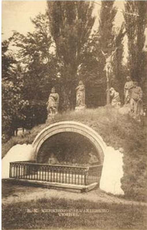
Calvarie berg anno 1900