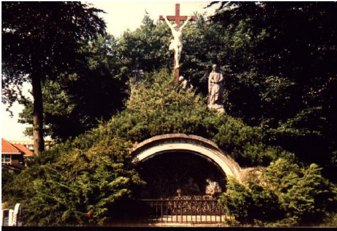
Calvarie berg anno 1977