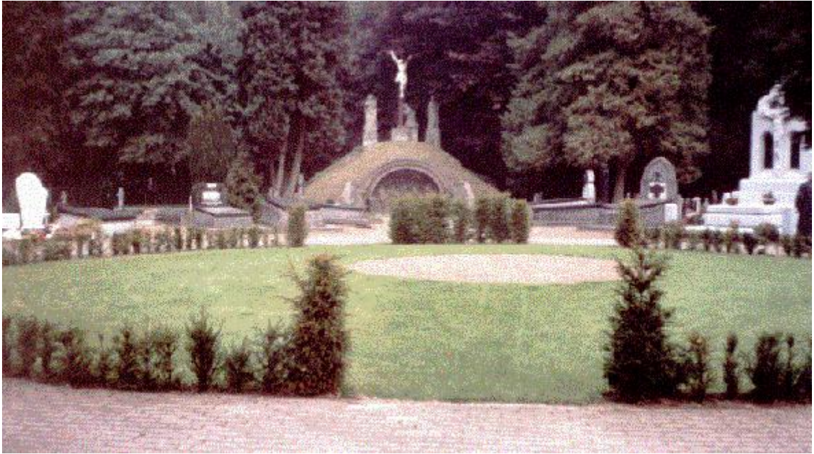
Familiegraf Calvarieberg anno 1996,

Thans in 2002 tot monument verklaard. De laatste restauratie werd voltooid, en is op 17 maart 2000 met het plaatsen van een nieuwe grafsteen en met een officieel tintje als bijna nieuw weer opgeleverd. Nu 2017 - 165 jaar oud Dat alles neemt niet weg, dat de "Calvarieberg" gedurende ruim anderhalve eeuw een monument in de wijde - toen landelijke - omgeving van Veghel is geweest en nog steeds is ondanks dat het door expansie is ingebouwd.